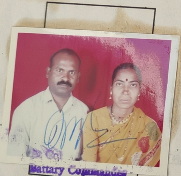
Battery Commander Demob Bty.