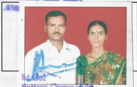
At Col Battery Commande Demob Bty