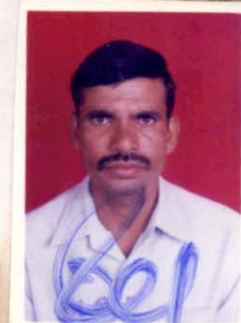
Battery Commander Demob Bty