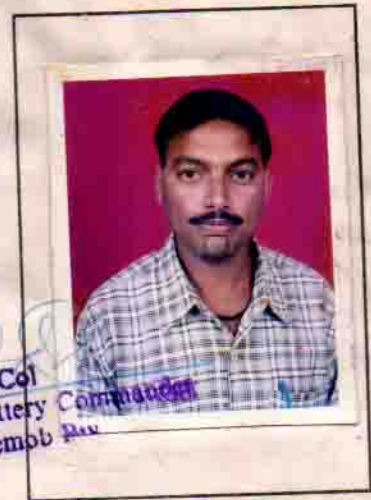
[Signature] Lt Col Battery Commander Demob Regt

I am ready to take employment at All India while the employment exchange office will make every effort to find employment to myself. EMPLOYMENT EXCHANGE