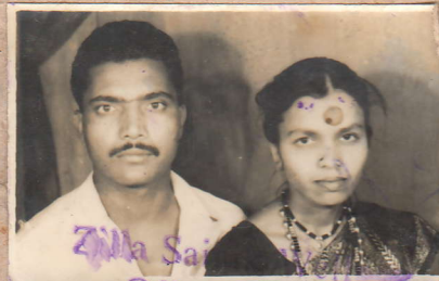
Zilla Sainik Welfare Officer, Beed.

प्रभावमूनी -- 26/आर्मा/83 -- 24-4-85 -- 3,00,000 रु०। MGIPNLK -- 26/Army/83 -- 24-4-85 -- 3,00,000 Booklets.