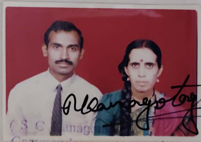
(S. C. Manag... Commander Officer-in-Charge Release Centre