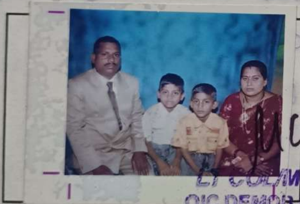
LI COL/MAJ OIC DEMOB SEC BEG & CENTRE