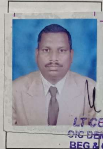
[Handwritten signature] LT COL/MAJ DIG DEMOB SEC BEG & CENTRE