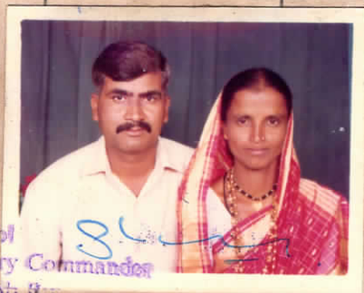
Bt Col Battery Commander Demob Bty