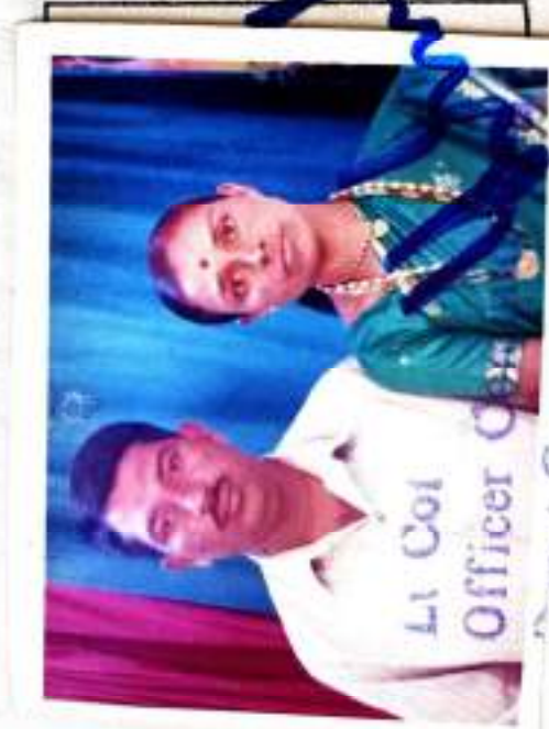
Depot Coy, ASC Centre