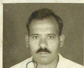
(PRAKASHAN. H. S.) 2/LIBUT COY. COMMANDER