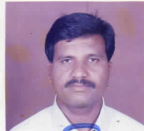
Lt Col Battery Commander Demob Bty