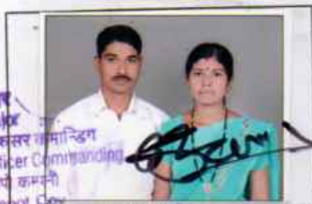
मेजर Major अधिसर कमान्डिंग Officer Commanding डिपो कम्पनी Depot Coy

(क) पेंशन भोगी तथा उसकी पत्नी का एक साथ फोटो Joint photograph of pensioner and wife.