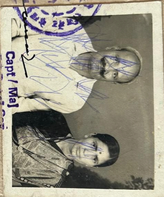
Capt / Maj