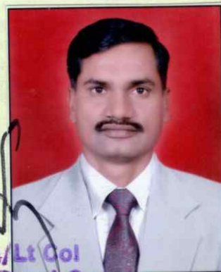
Maj/Lt Col OG Demob Coy Depot Regt (Corps of Signals)