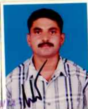
Maj/OC OC Demob Coy Depot Regt (Coms of Signals)