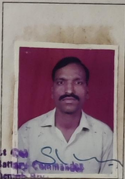
Lt Col Battal Commandant Depot Regt