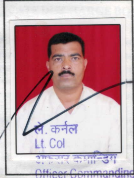
ले. कर्नल Lt. Col

ऑफिसर कमान्डिंग Officer Commanding डिपो कम्पनी Depot Coy ए.एस.सी. केन्द्र एवं महाविद्यालय ASC Centre & College