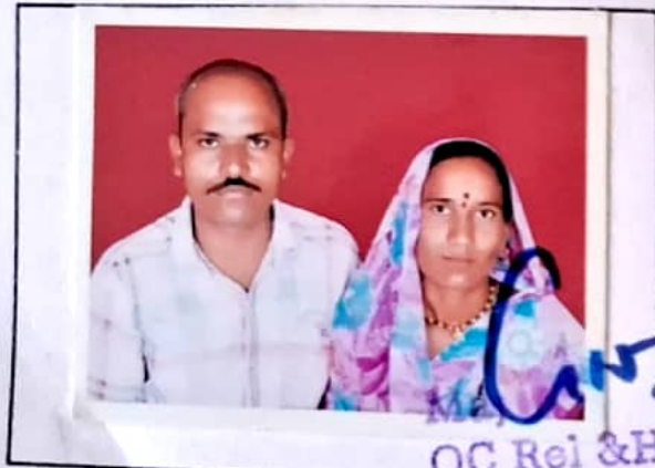
OC Rel & Hold Coy EME Depot Bn