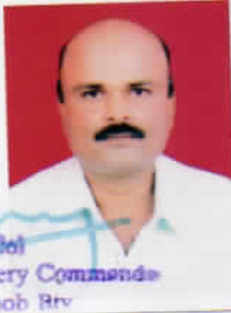
M. G. Gol Battery Commande On Job Rty