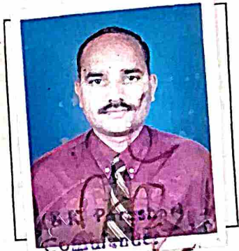
Officer-in-Charge Release Centre

I/ card NO MAH-08/6082409 dated 12/8/2010 issued Zilla Sainik Welfare Officer Osmanabad.