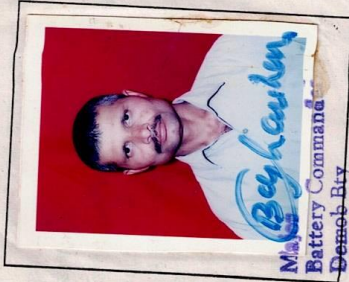
Beykarden Battery Command Demob Bty