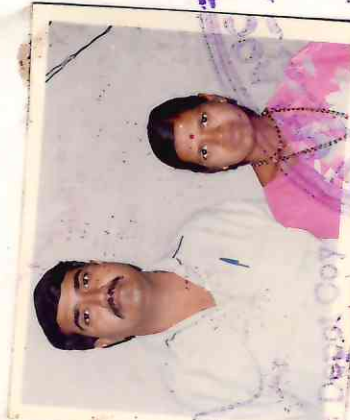
Capt/EC Coy Cdr Depts. Coy