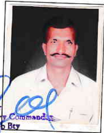
Major Battery Commander Demob Bty