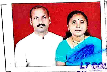
LTCOL MAJ OIC DEMOB SEC BEG & CENTRE