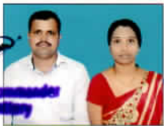
Lt Col Battery Commander Demob Battery

(a) Joint Photograph of Pensioner and Wife