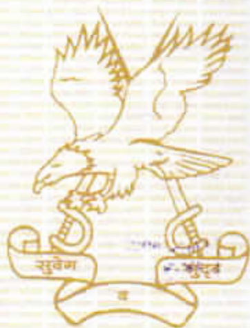
Li Col Battery Commander Demob Battery