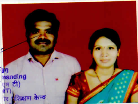
ले. कर्नल Lt Col अफसर कमान्डिंग Officer Commanding डिपो कम्पनी (एम टी) Depot Coy (MT) 2 सेना सेवा केंद्र प्रशिक्षण केंद्र 2 ASC Trg Centre

(क) पेंशन भोगी तथा उसकी पत्नी का एक साथ फोटो।