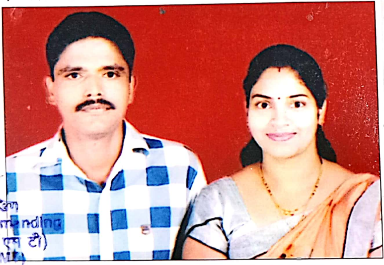
ले. कर्नल Lt Col अधीनस्थ कमान्डिंग Officer Commanding डिपो कम्पनी (एम टी) Depot Coy (MT) 2 सेना सेवा कोर प्रशिक्षण केन्द्र ASC Trg Centre

(क) पेंशन भोगी तथा उसकी पत्नी का एक साथ फोटो।