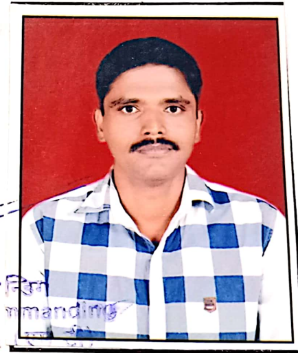
ले. कर्नल Lt Col अक्रसर कमाण्डिंग Officer Commanding डिपो कंपनी Dapot Coy (M) 2 सेना सेवा कोर प्रशिक्षण केन्द्र ASC Trg Centre