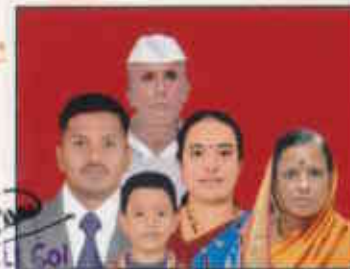
Lt Col Battery Commander Demob Battery

Joint Photograph of Pensioner with all dependents.