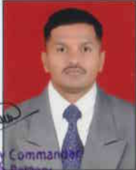
Lt Col Battery Commander Demob Battery