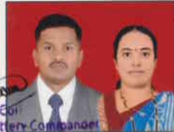
Lt Col Battery Commander Demob Battery