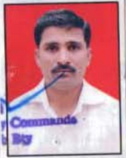
Lt Col Battal Commandant Detachment