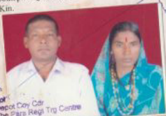
Col Depot Coy Cdr The Para Regl Trg Centre