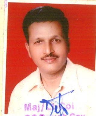
Maj/Dt Col CC Domb Coy Depot Regt (Corps of Signals),

जिल्हा सैनिक कल्याण कार्यालय, सातारा माहिती कर सुट प्रमाणपत्र देण्यात आले