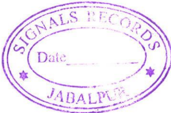
Lt Col Chief Record Officer For OIC Records