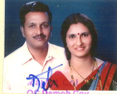
OC Demob Coy Depot Regt (Corps of Signals)