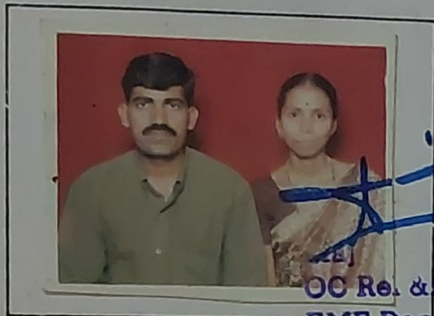
OC Rel. & Hold Coy EME Depot Bn

(ख) नं०, रैंक तथा नाम (b) No., Rank and Name