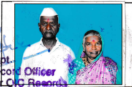
Capt. Record Officer For OIC Records