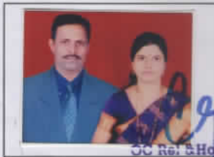
OC Ret. & Hold Coy EME Depot Bn