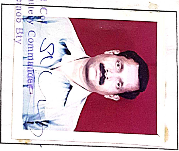
Lt Col Battery Commander Dehob Bty