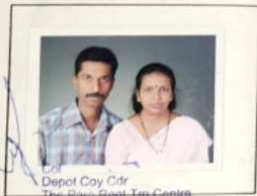
Col Depot Coy Cdr The Para Regt Trg Centre