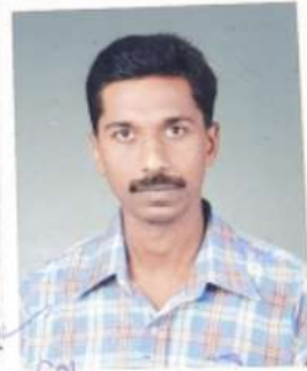
[Signature] Col Depot Coy Cdr The Para Regt Trg Centre