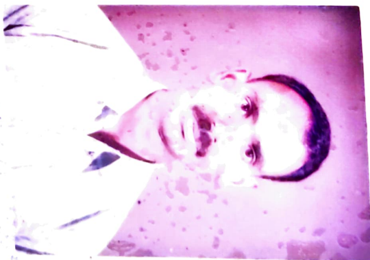
OIC Demob Sta BEG B Centre KIRKAS PUNE-2

रि. सैनिक वेलफेयर अधिकारी जिल्हा सैनिक वेलफेयर अधिकारी