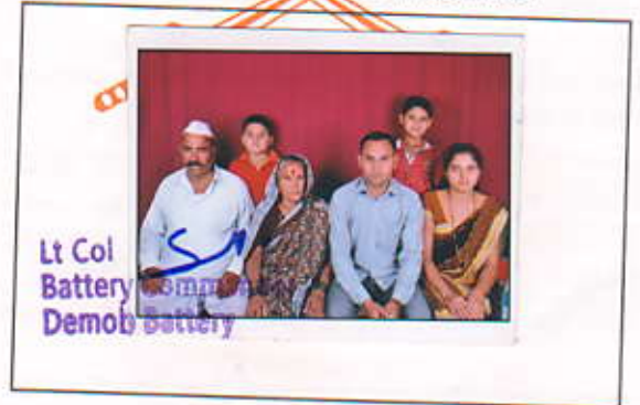
Lt Col Battery Demob Battery

56. पेंशन भोगी के साथ परिवार का संयुक्त फोटोग्राफ Joint Photograph of Pensioner with all dependents.