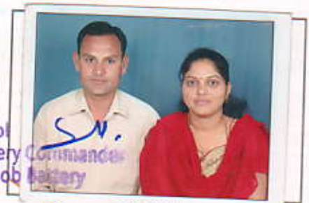
Lt Col Battery Demob Battery

55. पेंशन भोगी तथा उसकी पत्नी का एकसाथ फोटो Joint Photograph of Pensioner with wife.