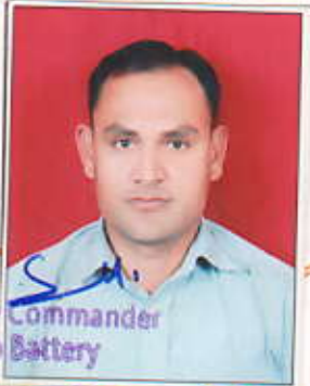
Lt Col Battery Commander Demob Battery