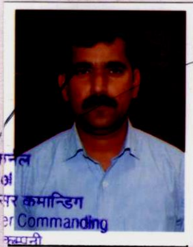
ले/कॉल Lt. Col अफसर कमान्डिंग Officer Commanding डिपो कर्मली Depot Coy ए.एस.सी केन्द्र एवं महाविद्यालय ASC Centre & College